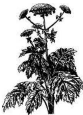
Рисунок 1 - Борщевик Сосновского

14. Борщевик Сосновского - многолетнее зонтичное растение, которое в середине 20-го века культивировалось как силосное. В настоящее время в проводится комплекс мероприятий по борьбе с этим растением. С чем это связано?