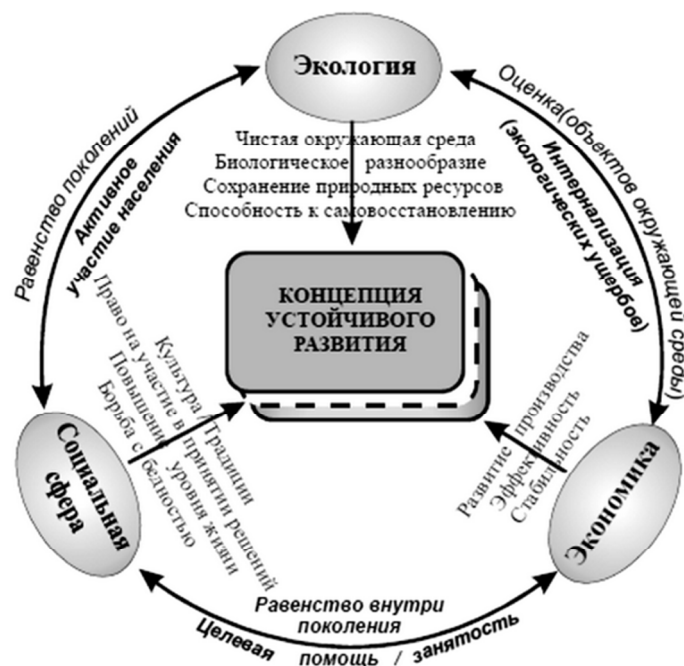
Рисунок 1 – Концепция устойчивого развития

1 Проанализируйте ниже представленную схему