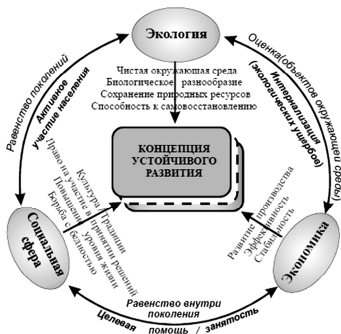
Рисунок 1 – Концепция устойчивого развития

1 Проанализируйте ниже представленную схему