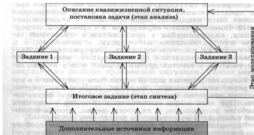
Рисунок 1 – Описание квазиз жизненной ситуации, постановка задачи

Общая структура проектной задачи связана напрямую с общим способом решения проблемных ситуаций и, как правило, включает в качестве основных этапов анализ, моделирование и синтез (рис. 1).