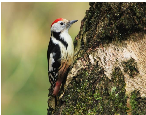
Рисунок 5 - Большой пестрый дятел ( Dendrocopos major )