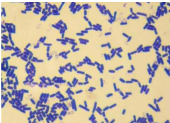
Рисунок 2 - Пример окраски спор у Bacillus subtilis

В связи с тем, что капсулы не окрашиваются подавляющим большинством красителей, для их выявления используют негативные препараты, в которых на окрашенном фоне можно наблюдать неокрашенные капсулы вокруг клеток.