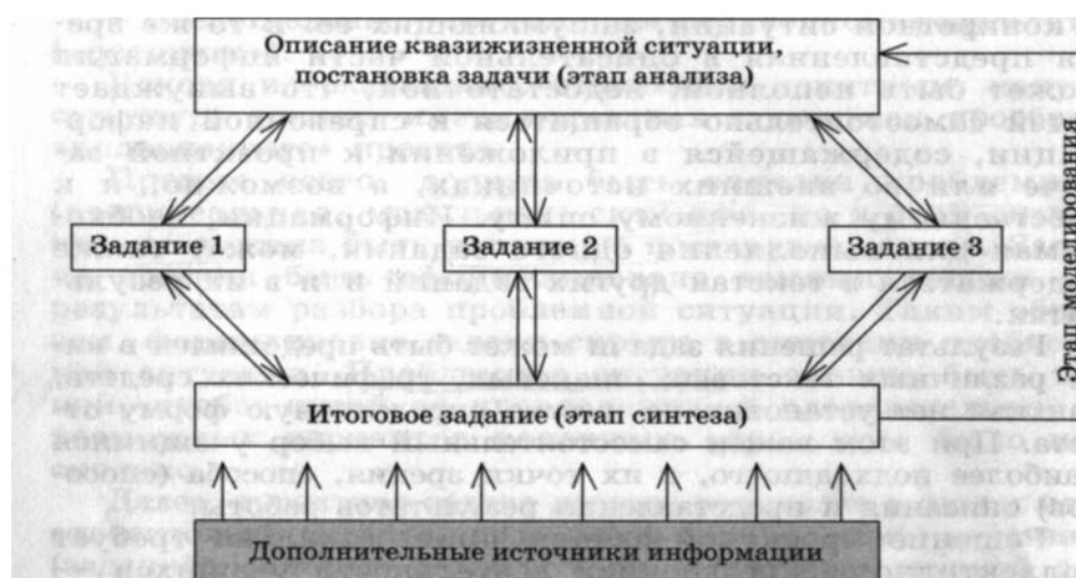
Рисунок 1 – Описание квазиз жизненной ситуации, постановка задачи

Общая структура проектной задачи связана напрямую с общим способом решения проблемных ситуаций и, как правило, включает в качестве основных этапов анализ, моделирование и синтез (рис. 1).