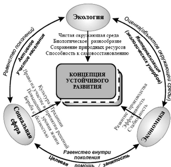
Рисунок 1 – Концепция устойчивого развития

1 Проанализируйте ниже представленную схему