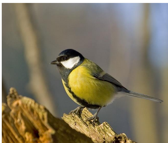
Рисунок 9 - Большая синица ( Parus major )