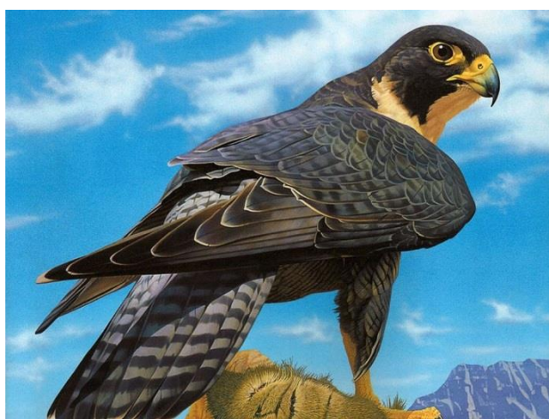
Рисунок 6 - Сокол сапсан ( Falco peregrinus )