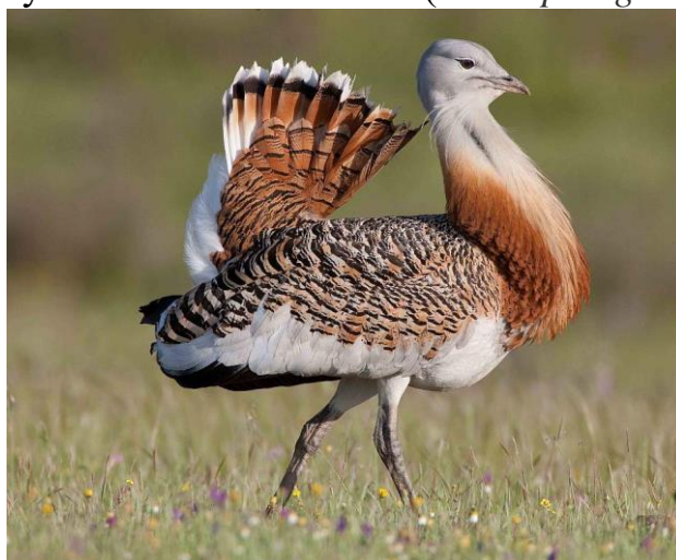
Рисунок 7 - Дрофа ( Otis tarda )