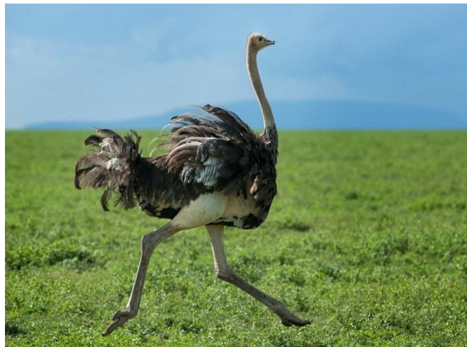
Рисунок 1 - Страус ( Struthio camelus )

Задание 2. Распределите птиц (рисунок 1-10) по экологическим группам (в таблицу, которая расположена в задании 3)