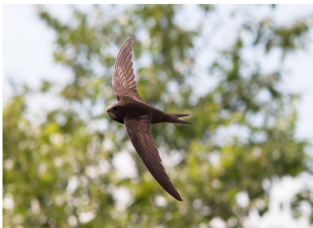
Рисунок 8 - Черный стриж ( Apus apus )