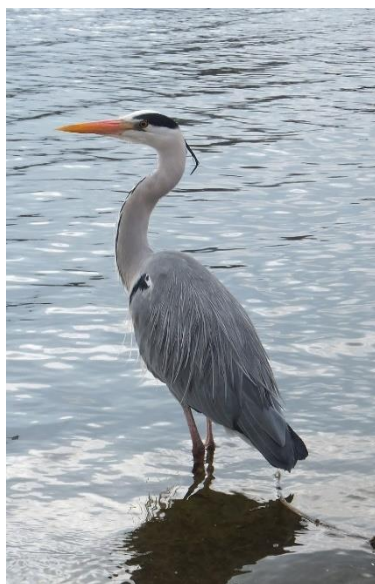
Рисунок 3 - Серая цапля ( Ardea cinerea )