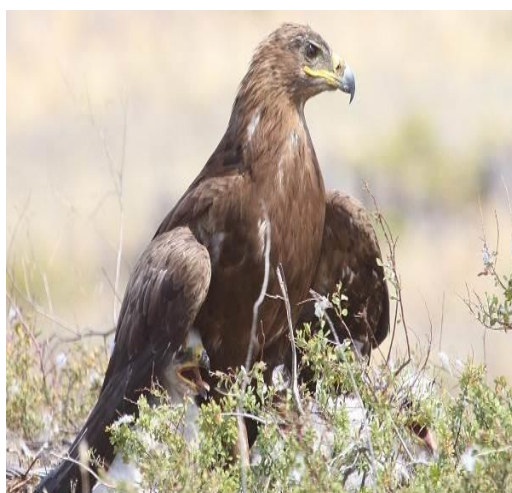
Рисунок 10 - Степной орел ( Aquila nipalensis )

Задание 3. Запишите приспособленность экологических групп птиц к местам обитания