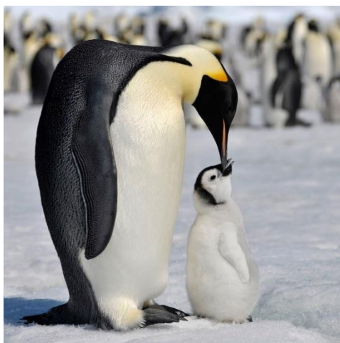
Рисунок 2 - Императорский пингвин ( Aptenodytes forsteri )